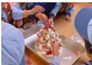
▲クリスマスケーキ作り