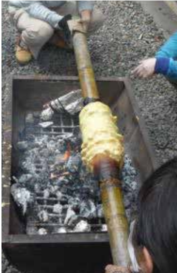
▲バウムクーヘン作り