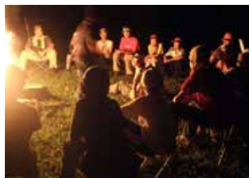
▲キャンプファイヤー(隊キャンプ)