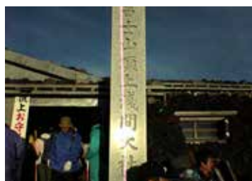
▲富士山登山(山頂にて)