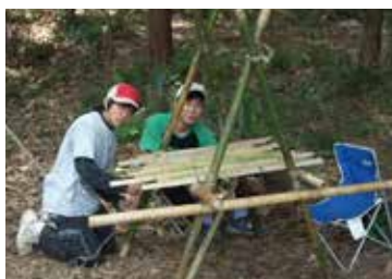
▲立ちかまどづくり