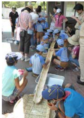
▲流しそうめん大会