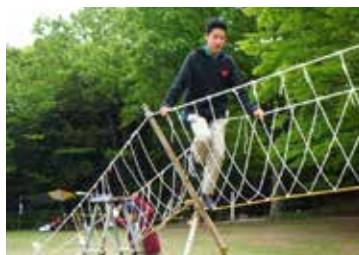
▲多摩センターこども祭りの支援