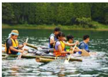
▲手作りいかだレース(夏キャンプ)