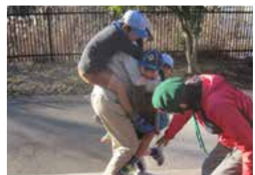
▲縦割り班でのポイントラリー