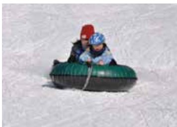
▲そり遊び(スキー訓練)