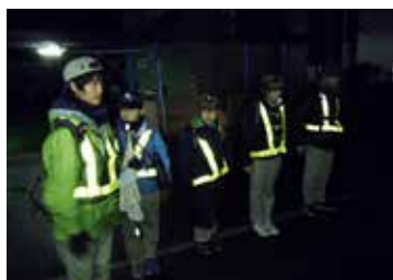
▲オーバーナイトハイク(夜間歩行)