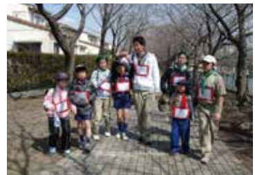
▲縦割り班でのポイントラリー

年に1・2回、ローバー隊企画運営の合同行事(BP祭・冬キャンプ)が催され、縦割り班での活動が行なわれます。