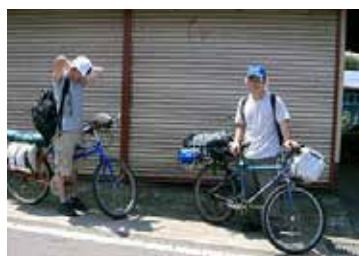
▲自転車での移動キャンプ (目的地: 富士山)