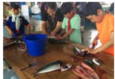
▲お魚さばき体験(野外料理)