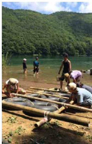
▲いかだ作り(夏キャンプ)