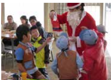
▲クリスマスパーティー